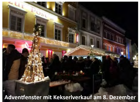
Adventfenster mit Kekserverkauf am 8. Dezember